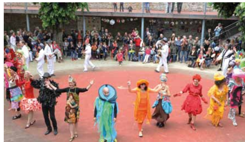
Défilé du Dé Joyeux

SAMEDI 20 OCTOBRE À 15H AU DÉPART DE LA PLACE ROYALE