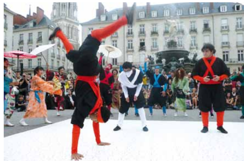
Odori Unity, les danseurs de So Odori