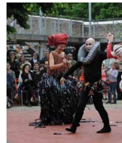
Défilé du Dé Joyeux

Pour fêter la réouverture de l'espace Cosmopolis, le Dé joyeux sort ses collections, et vous entraîne dans une déambulation débridée, parodie de défilé de mode, aux sons de la fanfare des Anchahuteurs.