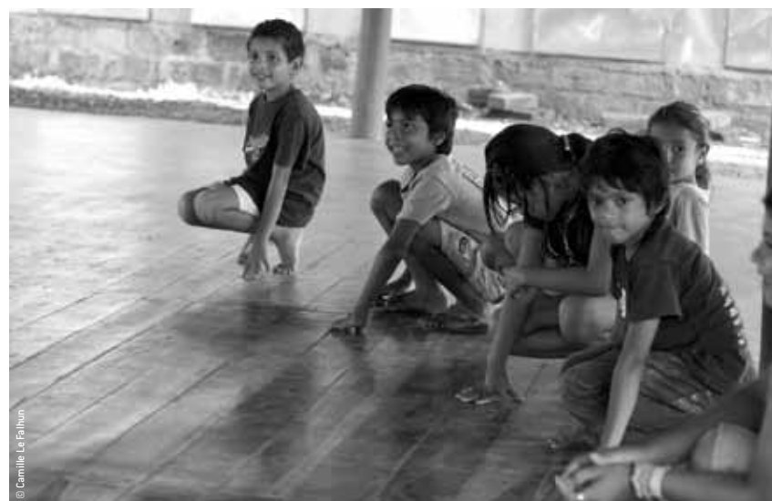
Enfants du cirque social, Escuela de mimo y de comedia, Granada, Nicaragua.

Pour accompagner la réouverture de l'espace, Euradionantes déplace ses studios à Cosmopolis. Émissions en direct, à suivre sur place ou à écouter sur 101.3 fm.