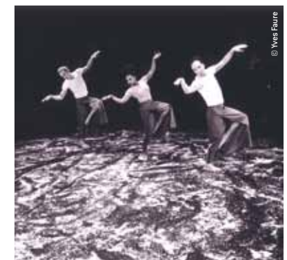
Je te donnerai, je te donnerai

Le Point de Vue, trio pour une danseuse et trois danseurs (20 mn).