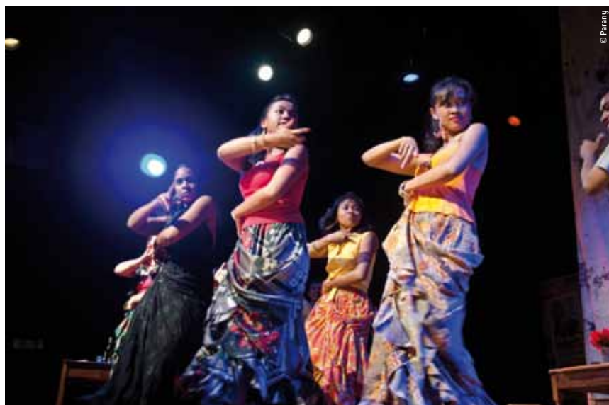
Carmen à Madagascar